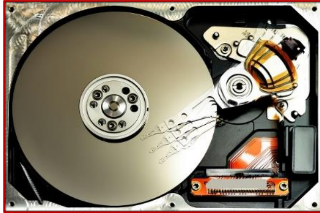
【 ハードディスク（HDD） 】

このハードディスクは、 レコードと同じ原理で、針を使って データの読み書きを行っています。